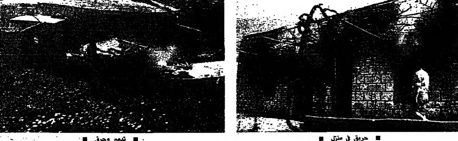
حرق في منزل تدمير وحرق نقل المصلين

قتلان واربعه معتقلين بينهم جريح ونسفت ثلاث منازل واحرقوا منزلين آخرين. وكانت عملية اجتياح كوثرية الاسرائيلية الجديدة التي استهدفت بلدة كوثرية السيد في قضاء صيدا بعد اقتحامها بقوات درت بكتيبة مشاة معززة بسرية ديبات.